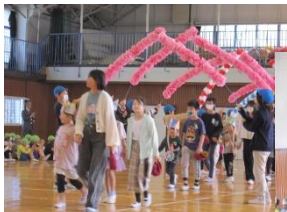
6年生と手をつないで入場

4月、子どもたちの笑顔と、子どもたちって優しいなあ、すごいなあと感じた場面を紹介します。