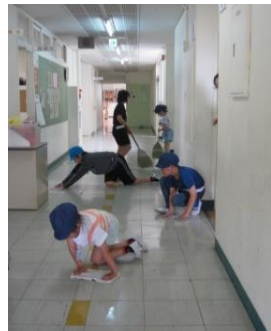
掃除の仕方を教える高学年